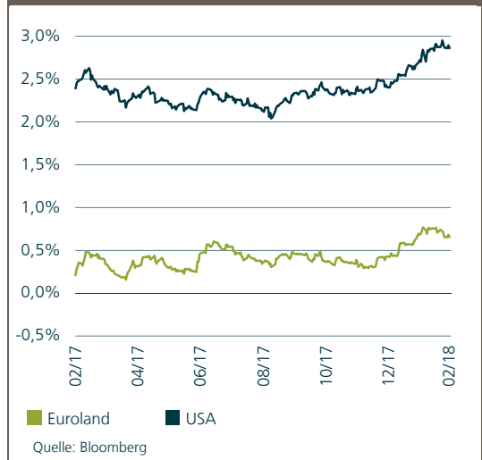
Rendite 10-jähriger Staatsanleihen USA vs. Euroland

Die gute Weltkonjunktur hat die Rohstoffnotierungen insbesondere in der zweiten Jahreshälfte 2017 in die Höhe getrieben. Doch dem deutlichen Kursrutsch an den Aktienmärkten konnten sich auch die Rohstoffpreise nicht entziehen. Nicht einmal dem Goldpreis gelang dies, obwohl die Abwärtskorrektur von verstärkten Inflationsorgen ausgelöst worden waren. Auf Jahressicht ergab dies ein gemischtes Bild, wobei Industriemetalle und Palladium zu den Gewinnern zählten. Öl der Sorte Brent notierte nach einem schwächeren ersten Halbjahr bei 45 US-Dollar im Tief Mitte Juni, erzielte im Anschluss jedoch – unterstützt vom nachgebenden US-Dollar – deutliche Zuwächse und beendete den Berichtszeitraum bei 66 US-Dollar.