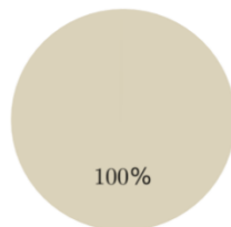
1. Taxonomie-Konformität der Investitionen einschließlich Staatsanleihen*

■ Taxonomiekonform ■ Nicht taxonomiekonform